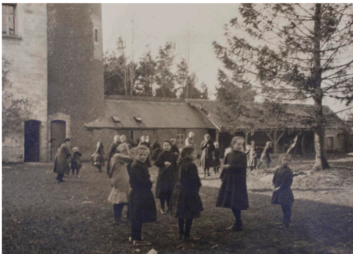
Weesmeisjes op het binnenplein van het kasteel van Wisques

Voor meer: bezoek de site: https://oorlogskantschool.wordpress.com/tussen-het-front-en-de-zee/